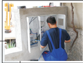
Postavljaju se nova mjerna mjesta