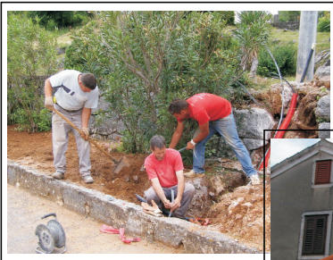
Polaže se podzemni kabel