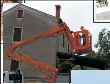
Skidaju se zračne linije