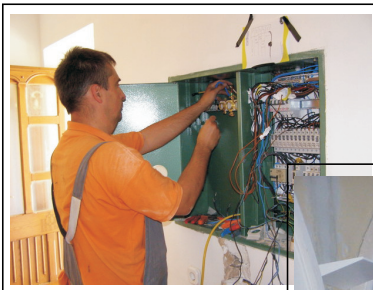
Uređuje se električni ormarić u sakristiji